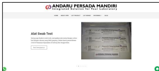
Gambar 1. Tampilan website Andaru Persada Mandiri

Website harus menyenangkan untuk digunakan dan dilihat. Persepsi pengguna atas kesenangan mempengaruhi mereka dalam anggapan mudah digunakan, motivasi untuk belajar bagaimana menggunakan website, keyakinan [2]. Untuk itu dibutuhkan evaluasi mengenai bagaimana kinerja website Andaru PM dalam menyampaikan informasi kepada para pengguna yang menggunakan website untuk mencari informasi yang mereka dibutuhkan. Untuk mengetahui sejauh mana kepuasan pengguna dalam menggunakan website Andaru PM dapat menggunakan teknik usability sebagai alat pengukuran [4]. Untuk menguji sebuah aplikasi web dapat dilakukan pada karakteristik functional suitability, compability, usability, dan performance efficiency [5]. Pengujian usability dapat dilakukan dengan metode heuristic evaluation dan sistem usability scale. Heuristic evaluation merupakan teknik pengukuran usability yang melibatkan ahli dalam melakukan pemberian nilai, sedangkan pada sistem usability scale melibatkan pengguna (end user) [6]. Usability dapat digunakan untuk mengukur kebergunaan perangkat lunak berbasis desktop, web, maupun mobile [4]. Pengukuran kepuasan juga dapat dilakukan dengan metode Nielsen Attributes of Usability (NAU) [7].