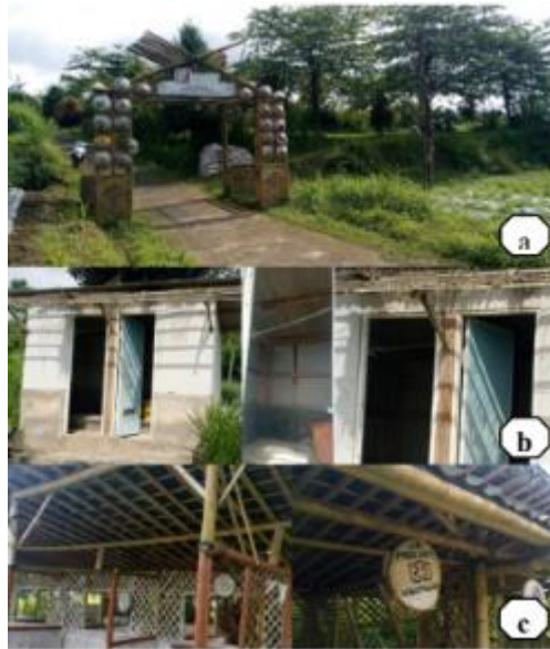
Gambar 1.2 Kondisi Pasar Ngatpaingan : a) pintu masuk b) toilet c) lapak

memberikan solusi penerangan di lokasi pasar Ngatpaingan dan juga memberikan edukasi kepada pengelola desa untuk dapat meningkatkan jumlah kunjungan wisata di desa Dangean.