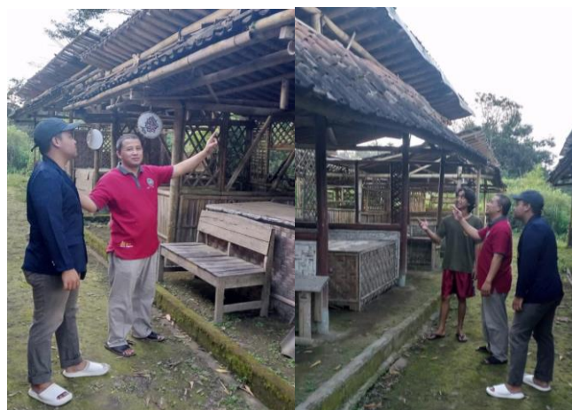
Gambar 3.4. Proses pendampingan dan evaluasi

Pendampingan berkelanjutan dilakukan untuk memastikan keberlanjutan program ini setelah pelaksanaan awal. Tim pelaksana terus memberikan dukungan kepada masyarakat dalam mengelola teknologi BOCARI, memperbaharui konten digital, dan memantau perkembangan pemasaran wisata secara digital. Evaluasi juga dilakukan secara berkala melalui survei terhadap anggota Kampung Wisata Dangean dan pengunjung untuk mengukur dampak dari kegiatan ini terhadap ekonomi lokal dan keberlanjutan wisata.