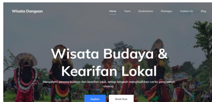
Gambar 3.3. Tampilan website wisatadangean.id

Pembuatan website resmi untuk Kampung Wisata Dangean dan papan informasi digital (digital signage) telah berhasil diterapkan sebagai bagian dari upaya untuk meningkatkan visibilitas dan aksesibilitas informasi wisata. Website ini tidak hanya berfungsi sebagai alat promosi, tetapi juga sebagai sistem reservasi yang terintegrasi, memudahkan wisatawan untuk merencanakan kunjungan mereka. Papan informasi digital yang terpasang di beberapa titik wisata memberikan informasi yang lebih interaktif dan mudah diakses oleh pengunjung.