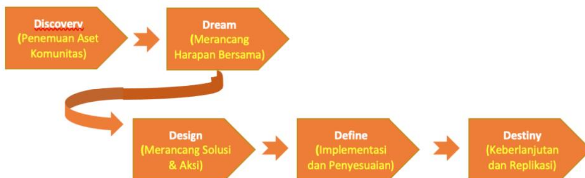
Gambar 2.1 Langkah metode ABCD