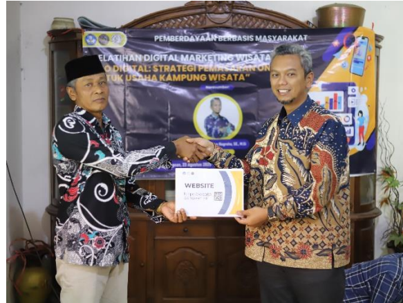
Gambar 3.3 Pelatihan Digital Marketing dan serah terima Website desa Dangean

Pelatihan yang diberikan kepada masyarakat Kampung Wisata Dangean tentang digital marketing dan pembuatan konten digital telah meningkatkan keterampilan mereka dalam mempromosikan wisata lokal. Meskipun Kampung Wisata Dangean sudah memiliki akun media sosial, pengelolaan konten dan promosi masih sangat terbatas. Pelatihan ini membantu masyarakat untuk membuat konten yang lebih menarik dan terstruktur, serta memanfaatkan platform media sosial dengan lebih baik.