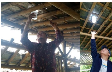
Gambar 3.2. Proses pemasangan BOCARI

Dengan memanfaatkan energi matahari dan bahan daur ulang, BOCARI memberikan solusi yang berkelanjutan untuk penerangan di daerah tanpa jaringan listrik. Ini tidak hanya mengurangi ketergantungan terhadap energi fosil, tetapi juga memberikan alternatif yang lebih ramah lingkungan. Penerangan yang didapatkan dari hasil BOCARI sudah cukup untuk memberikan penerangan di toilet, kamar mandi dan lokasi jualan pasar Ngatpaingan.