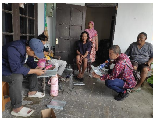
Gambar 3.1 Proses instalasi BOCARI

Sebagai solusi penerangan di Pasar Ngatpaingan yang tidak terjangkau oleh jaringan listrik PLN, teknologi BOCARI diterapkan di lokasi tersebut. Pemasangan BOCARI di setiap lapak pasar memungkinkan pasar untuk beroperasi hingga malam hari, meningkatkan jam operasional pasar, serta memberikan penerangan yang ramah lingkungan dan hemat biaya. Hasil yang diperoleh menunjukkan bahwa Pasar Ngatpaingan kini dapat beroperasi lebih lama, sehingga meningkatkan jumlah pengunjung dan memperbaiki pendapatan masyarakat setempat.