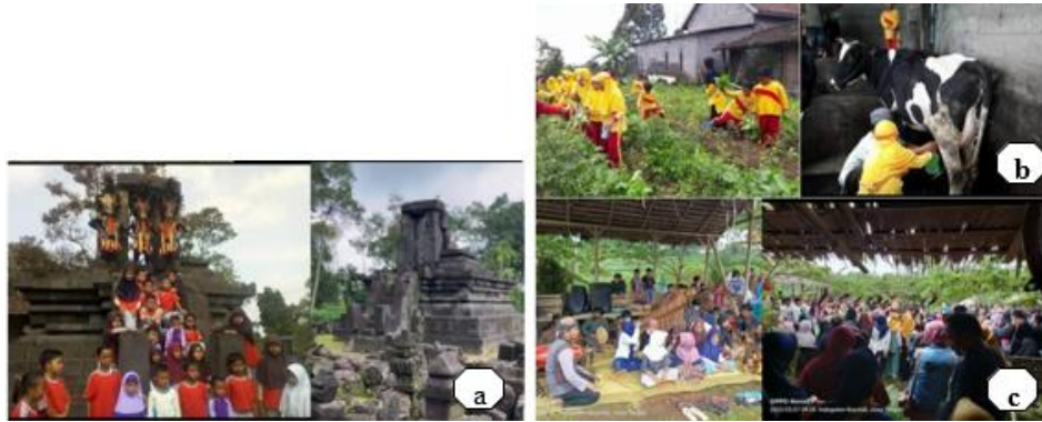
Gambar 1.1 Jenis wisata Kampung Wisata Dangean: a) sejarah b) edukasi c) Ekonomi Kreatif dan Budaya Lokal

Wisata sejarah yang dimiliki oleh KWD adalah adanya Candi Lawang yang merupakan peninggalan sejarah masa lampau (Nastiti et al. 2024). Kemudian untuk wisata edukasi, KWD memiliki program tanam dan panen sayuran. Selain itu, juga terdapat pilihan untuk melakukan kunjungan ke peternakan sapi perah warga dan juga terdapat edukasi pengolahan biogas menjadi energi listrik. Selanjutnya untuk wisata ekonomi kreatif dan budaya local, KWD memiliki Pasar Ngatpaingan yang digelar setiap 40 hari (selapan) sekali, dengan nuansa suasana tempo dulu dan menyajikan makanan tradisional jaman dahulu seperti lemet jagung, tiwul, gendar pecel, selonjongan, sawut, gemblong, sego jagung dan makanan lainnya (Sari 2024).