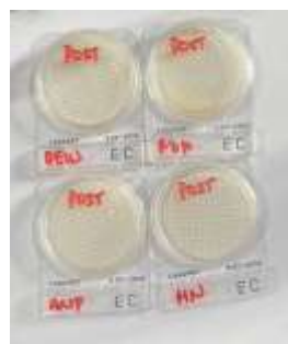
Gambar 7. Hasil Media Agar Sampel Post Air Sumur

Hasil ini memperlihatkan bahwa teknologi tersebut efektif dalam menurunkan kontaminasi mikrobiologis pada air sumur gali pascabanjir.