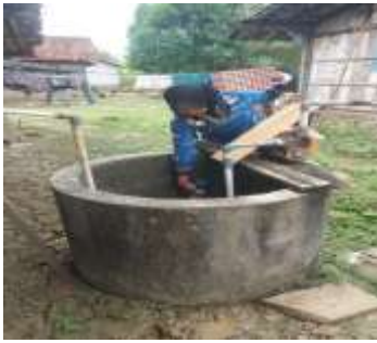
Gambar 3. Penerapan Chlorine Diffuser pada Sumur Gali