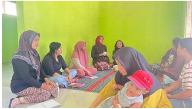
Gambar 2. Pemberian Edukasi