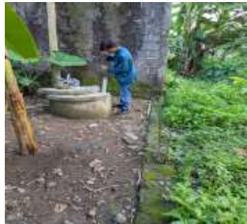
Gambar 4. Penerapan Chlorine Diffuser pada Sumur Gali