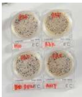
Gambar 6. Hasil Media Agar Sampel Pre Air Sumur

Selain itu, pemeriksaan kualitas air memperlihatkan penurunan jumlah Coliform dan E. coli setelah pemasangan chlorine diffuser selama 24 jam.