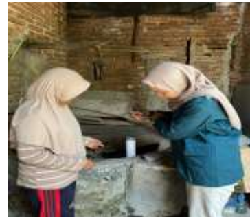
Gambar 5. Penerapan Chlorine Diffuser pada Sumur Gali

Materi yang diberikan meliputi fungsi kaporit sebagai desinfektan pascabanjir, demonstrasi pembuatan chlorine diffuser, serta praktik pemasangan pada sumur gali. Selama penyuluhan, pengetahuan peserta diukur menggunakan pretest dan posttest.