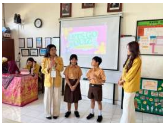
Gambar 3. Sesi Games Q & A

Berdasarkan Gambar 2, terlihat bahwa kegiatan edukasi literasi keuangan digital dilakukan secara langsung di dalam kelas dengan menggunakan PowerPoint. Penyampaian materi dilakukan secara interaktif kepada siswa kelas 4A, sehingga memudahkan siswa dalam memahami konsep dasar literasi keuangan serta bahaya pinjaman online. Hal ini didasarkan oleh penelitian yang mengatakan bahwa edukasi literasi keuangan digital secara langsung dapat meningkatkan pemahaman individu dalam menggunakan layanan keuangan secara aman dan tepat (Femilia & Dian Eka, 2025).