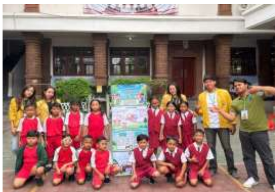
Gambar 5. Pemberian Banner

Berdasarkan Gambar 4, memasuki tahap penutup yang ditandai dengan sesi dokumentasi bersama antara mahasiswa dan siswa kelas 4A setelah seluruh rangkaian sosialisasi selesai dilaksanakan. Di tahap ini, suasana kegiatan berjalan dengan penuh antusiasme, yang memperlihatkan bahwa siswa merasa gembira dan terlibat aktif selama kegiatan berlangsung. Penutupan ini juga menjadi bentuk penguatan akhir terhadap materi yang telah diberikan kepada siswa.