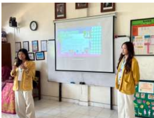
Gambar 2. Edukasi Mengenai Literasi Keuangan Digital

Namun meskipun hasil yang didapatkan memuaskan, untuk memastikan edukasi ini untuk selalu diterapkan dan di laksanakan secara nyata, orang – orang terdekat dari siswa -siswi kelas 4A SDN 2 Dangin Puri seperti guru dan orang tua juga harus memberikan dukungan dengan terus membantu memonitoring siswa – siswi secara berkala dalam penggunaan teknologi terutama HP dan terus mengingatkan kembali terkait bagaimana untuk mengelola keuangan dengan baik, serta bahayanya pinjaman online dan budaya instan. Keluarga merupakan lembaga sosial terkecil yang berperan serta dalam pembangunan nasional (Rosalina Widyayanti et al., 2024). Dengan diadakannya hal ini diharapkan mampu untuk pemahaman terkait literasi keuangan digital sejak dini guna menangkal paparan iklan pinjaman online dan budaya lingkungan online seluruh siswa untuk terus terealisasi dengan baik, bermanfaat, dan efektif.