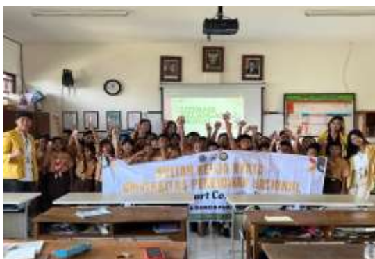
Gambar 4. Penutupan Program Kerja

Berdasarkan Gambar 4, memasuki tahap penutup yang ditandai dengan sesi dokumentasi bersama antara mahasiswa dan siswa kelas 4A setelah seluruh rangkaian sosialisasi selesai dilaksanakan. Di tahap ini, suasana kegiatan berjalan dengan penuh antusiasme, yang memperlihatkan bahwa siswa merasa gembira dan terlibat aktif selama kegiatan berlangsung. Penutupan ini juga menjadi bentuk penguatan akhir terhadap materi yang telah diberikan kepada siswa.