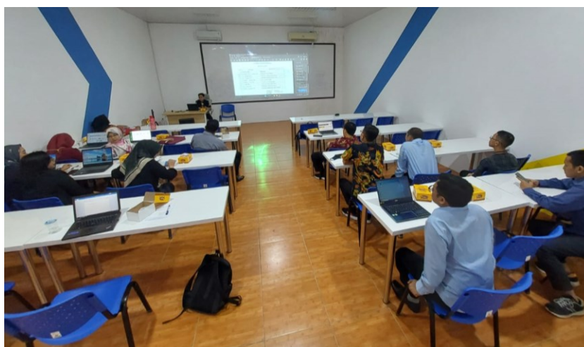
Gambar 3. Peserta Sosialisasi Alur Tugas Akhir

Berdasarkan pengamatan pada hasil kegiatan sosialisasi tugas akhir pada dosen dan tenaga kependidikan di Universitas Harapan Bangsa, ditemukan bahwa alur tugas akhir baru diketahui pada saat sosialisasi alur tugas akhir ini dilaksanakan sedangkan mengenai pedoman tugas akhir sudah dipahami oleh dosen sedangkan untuk tenaga kependidikan pedoman serta alur baru diketahui pada saat sosialisasi tersebut.