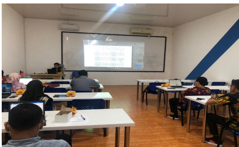
Gambar 5. Peserta Sosialisasi Alur Tugas Akhir

Setelah mengikuti Sosialisasi tugas akhir untuk dosen dan tenaga kependidikan di Universitas Harapan Bangsa, peserta diharapkan: