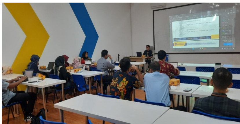
Gambar 2. Pemateri Menyampaikan Materi Tentang Sosialisasi Alur Tugas Akhir

Sosialisasi alur tugas akhir ini diharapkan dapat membantu mahasiswa, dosen pembimbing, dosen penguji, tenaga kependidikan dan semua pihak yang terkait dalam memahami prosedur penyusunan proposal, pembimbingan, pengajuan ujian, pelaksanaan ujian, maupun penilaian sehingga proses penyelenggaraan tugas akhir atau publikasi ilmiah dapat berjalan dengan lancar dan tepat waktu.